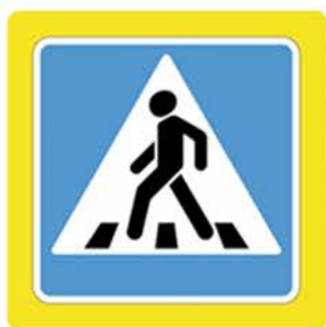
Наземный пешеходный переход