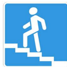
Надземный пешеходный переход